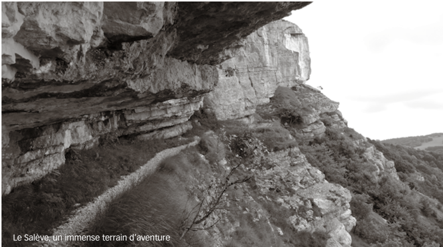
Le Salève, un immense terrain d'aventure