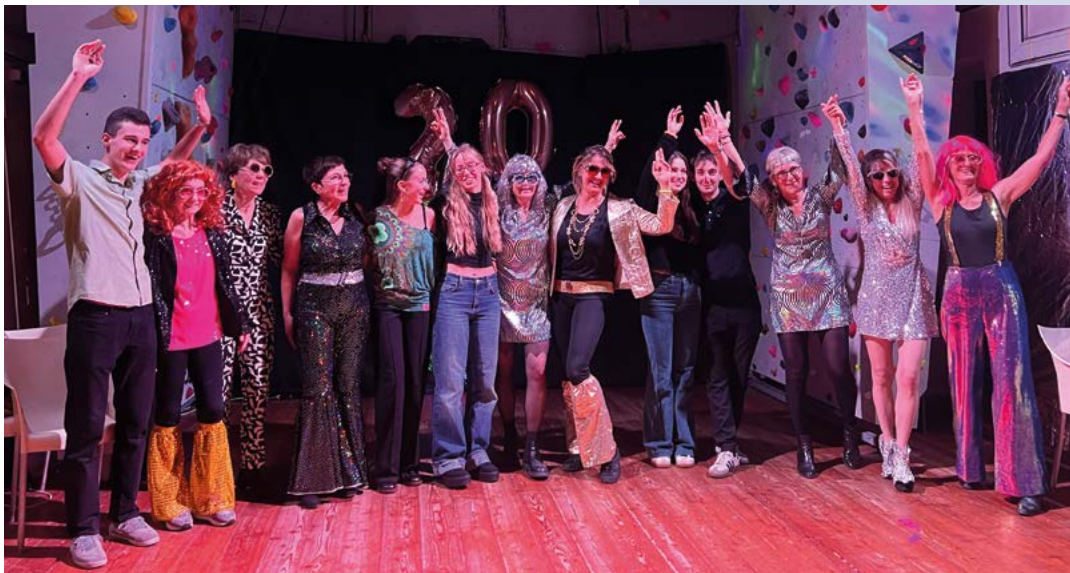
La farandole des bénévoles