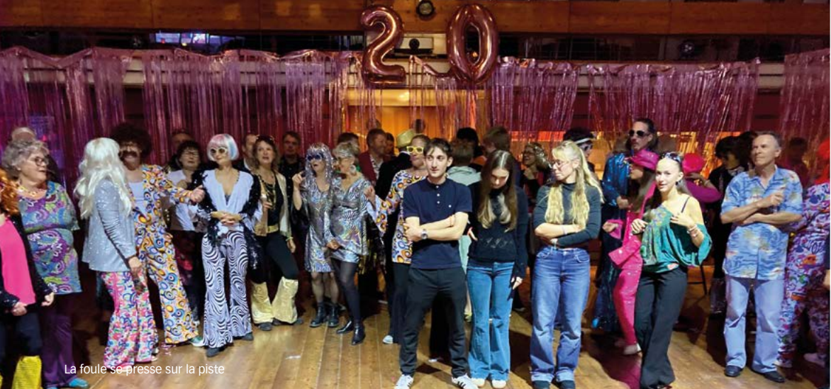
La foule se presse sur la piste