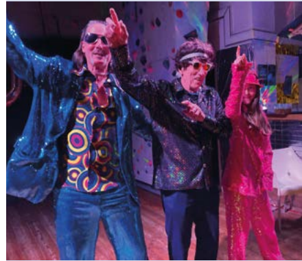
Trois générations de Chevalier