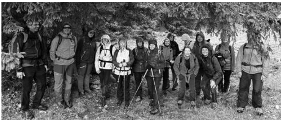
Rando gastro, une belle équipe!