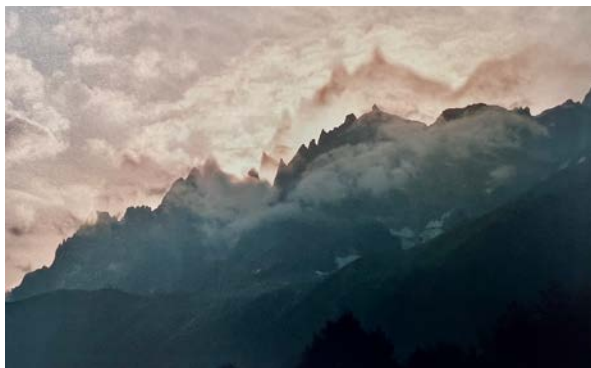
Jeux d'ombres et de lumière