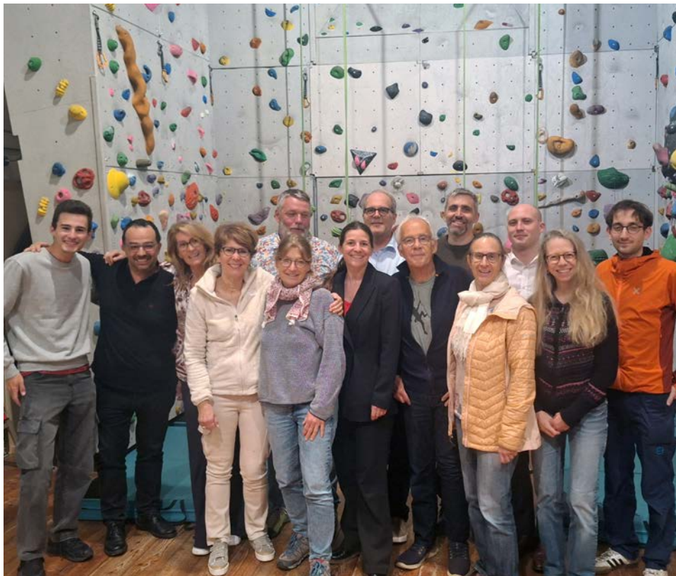
Devant le mur de grimpe, in corpore, les membres de l'actuel comité.