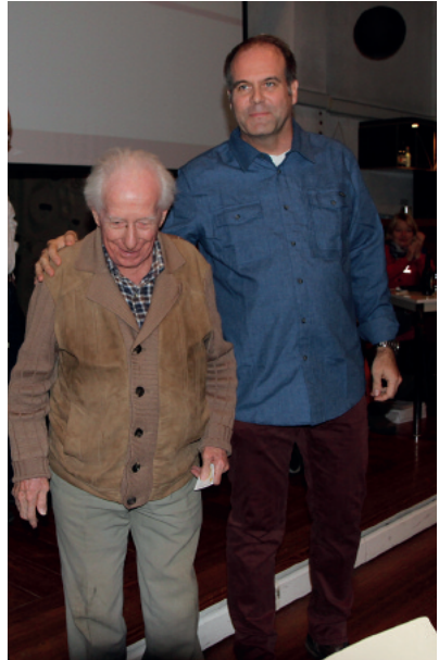
Moulines, 75 ans de sociétariat

D'autres projets ont été menés, respectivement sont en cours, notamment l'installation du wifi à la MAM, l'archivage électronique des documents du comité, la mise sur pied d'un concept de gestion de crise, réflexions sur l'attractivité du club et gestion de la relève, réflexion sur l'indemnisation des responsables pour leurs frais et leurs activités de formateurs. Je souhaite cependant souligner que même si certains des projets présentés ici n'ont pas de lien direct avec la montagne, le comité ne perd pas de vue le but principal de notre club, j'en veux pour preuve que nous continuons nos efforts en vue de créer des vocations chez les jeunes et de rester attractifs pour toutes les générations avec un programme varié et pour tous les goûts. Evidemment, ceci dépend aussi de l'implication de tous les membres dans la vie du club et plus particulièrement des cadres.