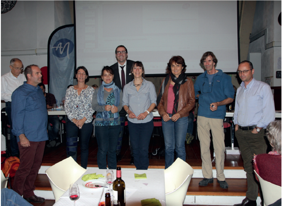
Quelques nouveaux membres de l'année