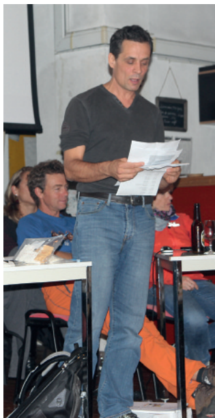
Quelques responsables de commission