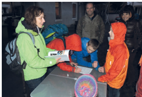
Le poste de la connaissance