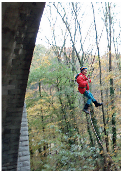
Sous le pont Butin, le principe de l'araignée