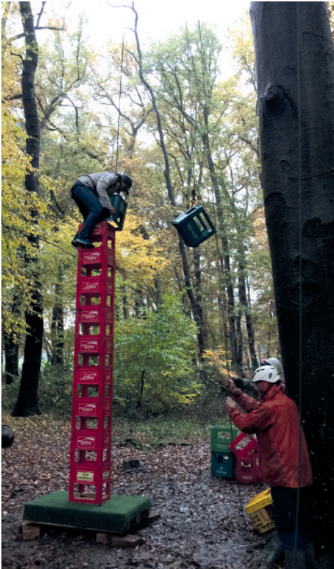
Exercice d'équilibre au cirque de la MAM