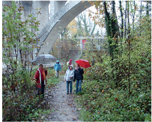
Une ambiance très humide pour organisateurs et participants