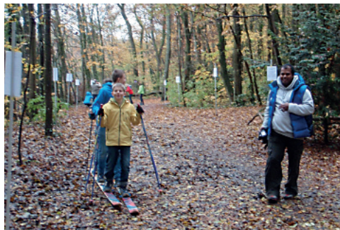
Du ski nordique très particulier