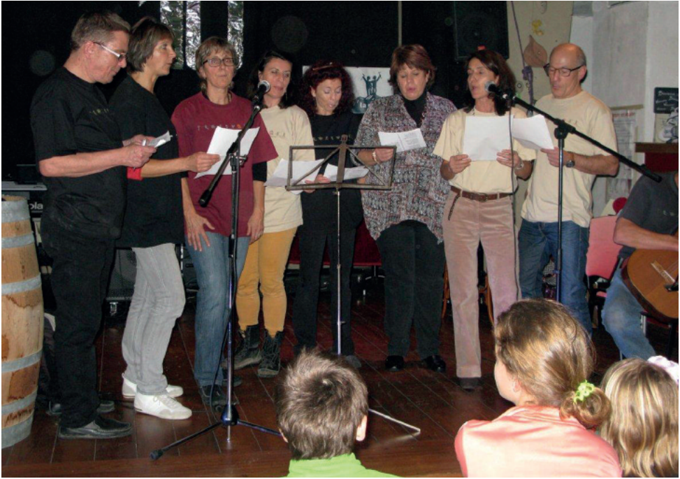
L'une des attractions de la soirée, les chansons et notre désormais célèbre Madame la MAMquise